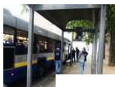
Attualità Priorità ai semafori, riduzione delle fermate: il M5S punta a velocizzare i bus